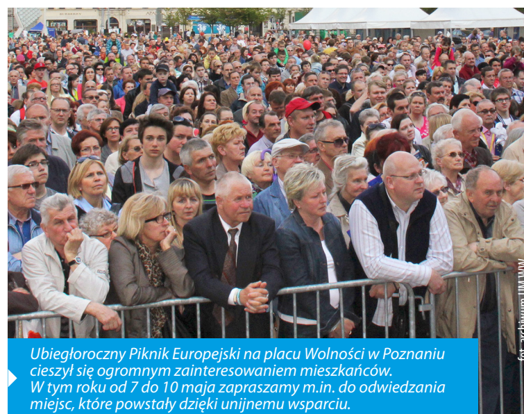
Ubiegłoroczny Piknik Europejski na placu Wolności w Poznaniu cieszył się ogromnym zainteresowaniem mieszkańców. W tym roku od 7 do 10 maja zapraszamy m.in. do odwiedzania miejsc, które powstały dzięki unijnemu wsparciu.