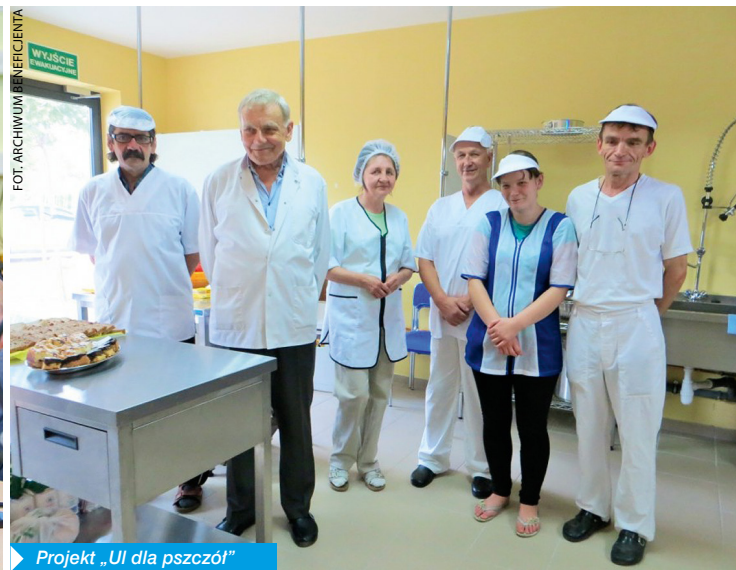
Projekt „Ul dla pszczół”