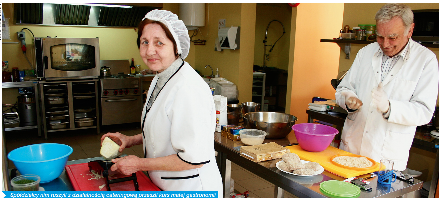
Spółdzielcy nim ruszyli z działalnością cateringową przeszli kurs małej gastronomii

dziwi więc, że „Ul dla pszczół” zyskał przychyłość i uznanie, co zaowocowało nagrodą.