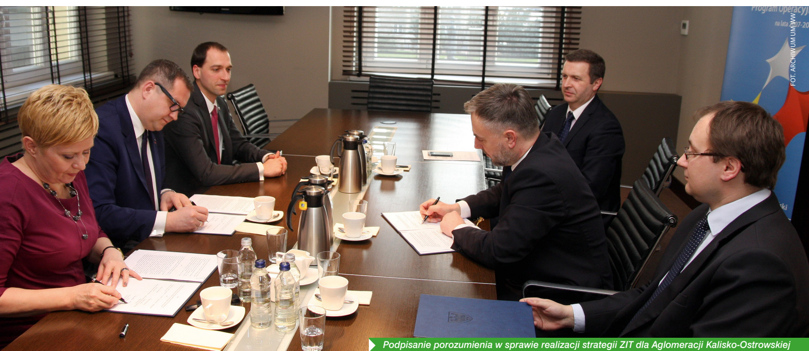
Podpisanie porozumienia w sprawie realizacji strategii ZIT dla Aglomeracji Kalisko-Ostrowskiej

Samorządy, aby móc starać się o pieniądze dostępne w ramach ZIT, zobowiązane były do partnerstwa (w zależności od stopnia delegacji zadań np. związek międzygminny, porozumienie, stowarzyszenie), a następnie opracowania wspólnej strategii, będącej najważniejszym dokumentem warunkującym zdobycie unijnych dotacji. W strategii powinny być nakreślone cele, kierunki rozwoju, zasady współpracy oraz zakres planowanych inwestycji przeznaczonych do realizacji, wynikających z analizy barier i potencjałów rozwojowych danego obszaru. Wszystkie te wymogi dążą do tego, by gminy chętniej realizowały part-