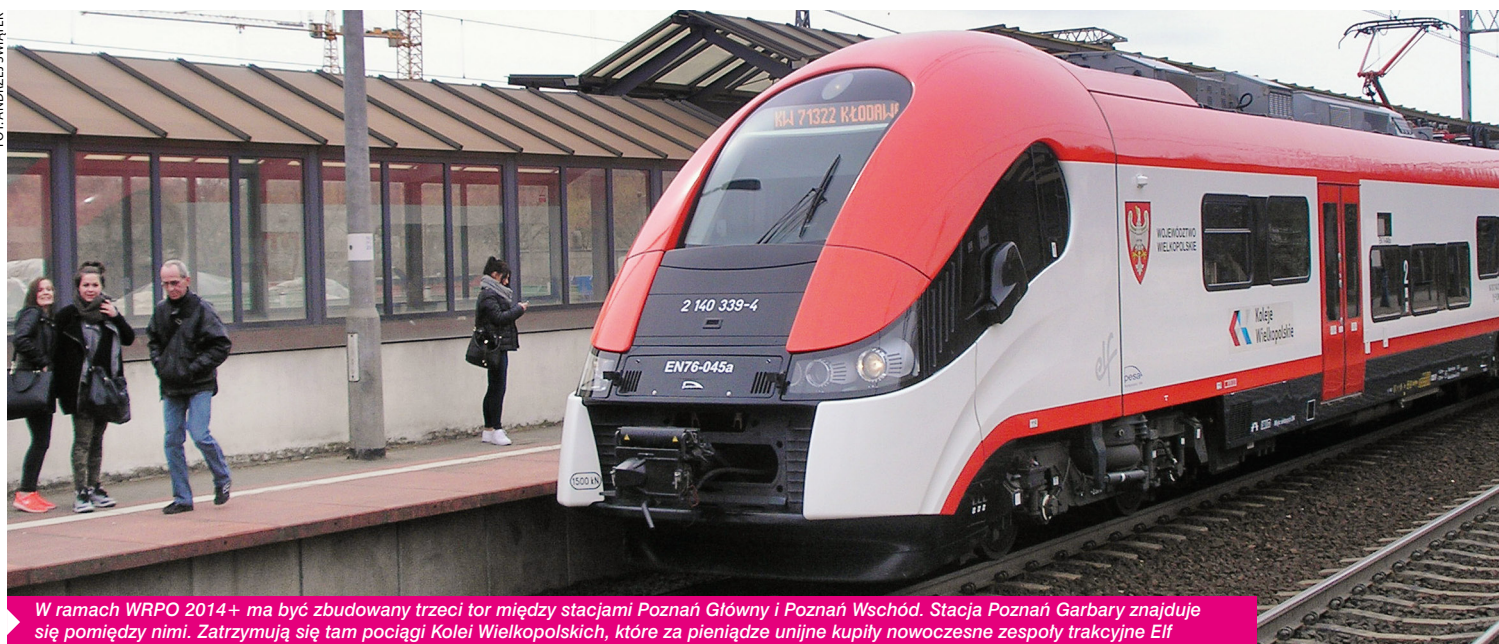
W ramach WRPO 2014+ ma być zbudowany trzeci tor między stacjami Poznań Główny i Poznań Wschód. Stacja Poznań Garbary znajduje się pomiędzy nimi. Zatrzymują się tam pociągi Kolei Wielkopolskich, które za pieniądze unijne kupiły nowoczesne zespoły trakcyjne Eif

operacyjnych i z każdego z nich mogły być wspierane jedynie oddzielne projekty. Z pierwszego zadania z szeroko pojętej infrastruktury, z drugiego – projekty dotyczące np. budowy kapitału ludzkiego. Połączenie obu źródeł finansowania powoduje wzmocnienie efektów projektów łączących ze sobą zarówno elementy społeczne, jak i inwestycyjne. Przykładem może być budowa przedszkola sfinansowana z EFRR, w którym znajdują się nowe miejsca dla dzieci korzystających z atrakcyjnych zajęć sfinansowanych z kolei z EFS. Projekty mogą być oddzielne, ale ich charakter będzie wzajemnie komplementarny.