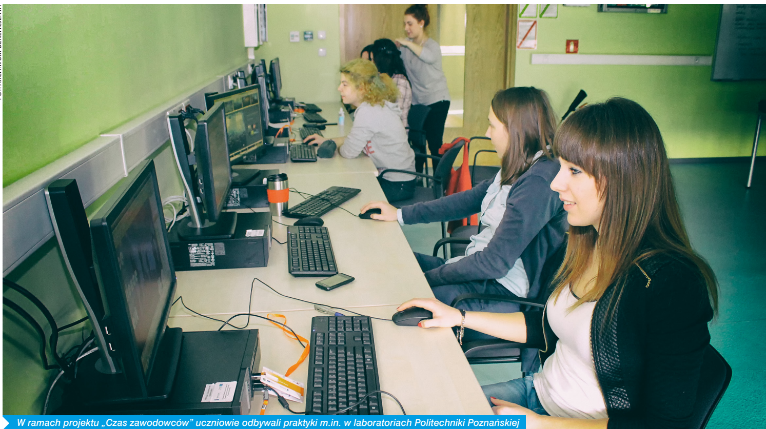
W ramach projektu „Czas zawodowców” uczniowie odbywali praktyki m.in. w laboratoriach Politechniki Poznańskiej

– To działanie wpisujące się w priorytety nowoczesnego kształcenia zawodowego. Szkoły kształcące zawodowo zmieniają się na naszych oczach.