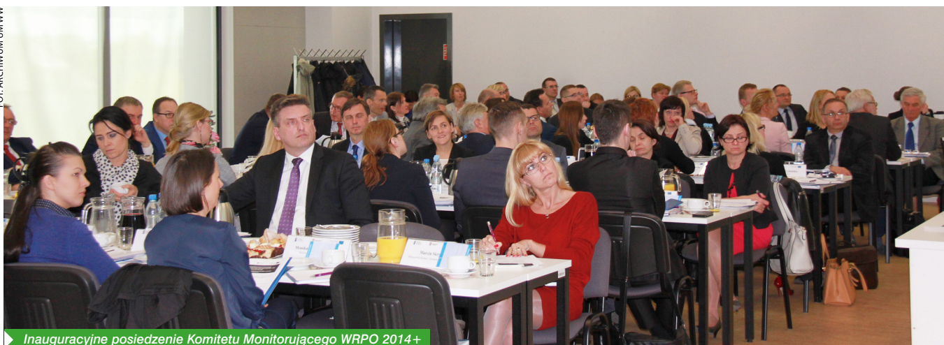
Inauguracyjne posiedzenie Komitetu Monitorującego WRPO 2014+