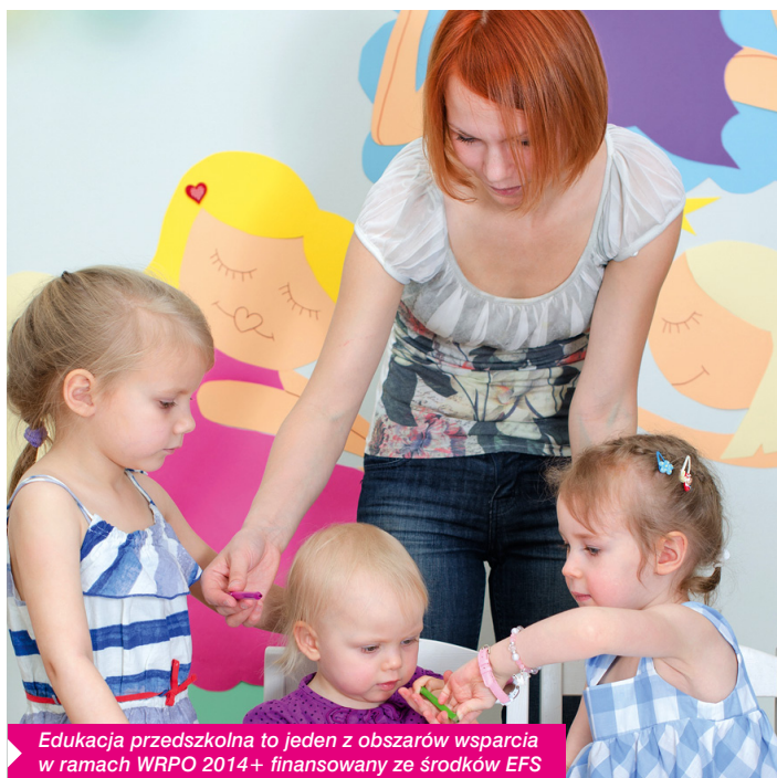
Edukacja przedszkolna to jeden z obszarów wsparcia w ramach WRPO 2014+ finansowany ze środków EFS

Istotną zmianą wobec WRPO 2007-2013 jest finansowanie projektów z dwóch funduszy: Europejskiego Funduszu Rozwoju Regionalnego i Europejskiego Funduszu Społecznego. Dotychczas oba fundusze były wydatkowane w ramach różnych programów