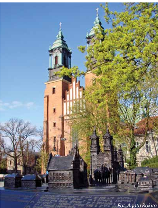
Katedra pw. Apostołów Piotra i Pawła na Ostrowie Tumskim