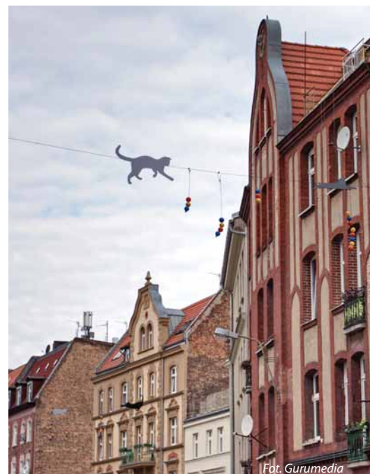
Śródka to dzielnica, którą możemy odkrywać na nowo