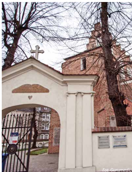
Kościół św. Małgorzaty na Rynku Śródeckim